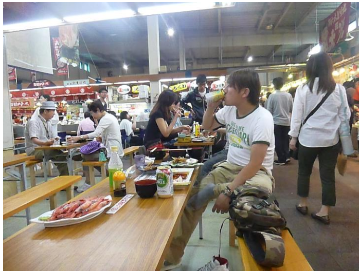
ヨッシーさんのノンアルコールビール