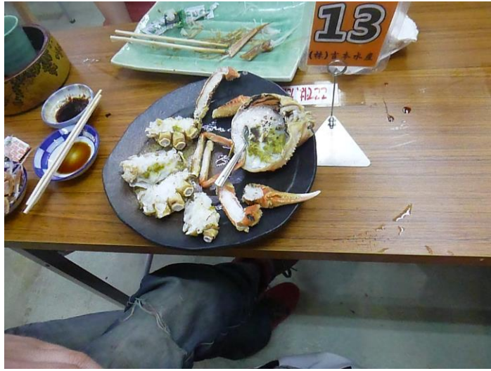
シモネさんの焼きガニ（時価）